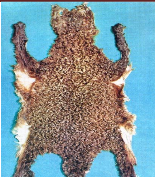
5-rasm. Qambarrang qorako'ning Qalamgul I navi.