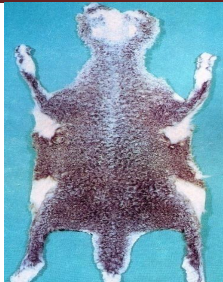
6--rasm. Guligaz qorako'ning Qalamgul I navi.

I-navlarga tola qoplami tig'iz, ipaksimon, yaltiroq, yuzasini qayishqoq qalami, loviyasimon va yolsimon gullari egallagan qorako'l terilari kiritiladi.