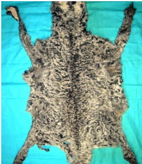
3-rasm. Qoraqalpoq surining yassi I-navi.

Yuzasida mavjud qorako'l gullarining xil va shakllariga, tola qoplami o'siqligiga qarab sur rang qorako'l quyidagi guruhlariga ajratiladi: