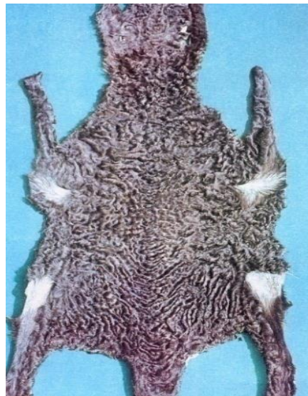
4-rasm. Buxoro surining qobirg'asimon I-navi

Yarimdoiragulli (jaket) - terining sag'ri va orqa qirrasini asosan har xil uzunlik va kenglikdagi mustaxkam va qayishqoq qalami gullar va oz miqdordagi yolsimon gullar egallagan. Yonboshlarida mustahkam katta va o'rta o'lcham