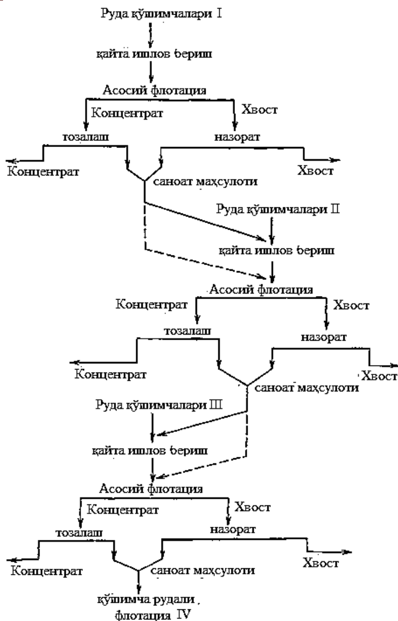
расм. Ёниқ циклдаги флотация схематик диаграммаси

Ушбу схема бўйича олтинни танлаб эритганда қуйидаги кўрсаткичлар олинган: 25 кун давомида 100 л/т цианид эритмаси билан суғориш интенсивлигида танлаб эритмага ўтказиш учун олтин қазиб олиш 54,8 кг / т чиқинди цианид истеъмоли билан 1,5% бўлган. Ўз тадқиқотлари натижалари ва адабий маълумотларга кўра, баъзи ҳолларда галоген тизимлар билан олтинни эритиб олиш цианидлардан кўра кўпроқ мос келади. Ётқизилган бактериал оксидли пирит чиқиндилари 0,02 % суғориш кучайтирилганда кунига 100 л/т концентрацияси билан ишлайдиган ёд эритмаси билан ишланади. Эритмалардан олтинни олиш учун кимёвий чўктириш усули ишлатилади. Кулсиз эритмалари ёдни қайта тиклаш учун электролизга йўналтирилди. 17 кун давомида сув билан эритилиши натижасида бактериал оксидланган маҳсулотидан олтин қазиб олиш 0,05 кг/т ёд истеъмоли яъни 60 % ни ташкил