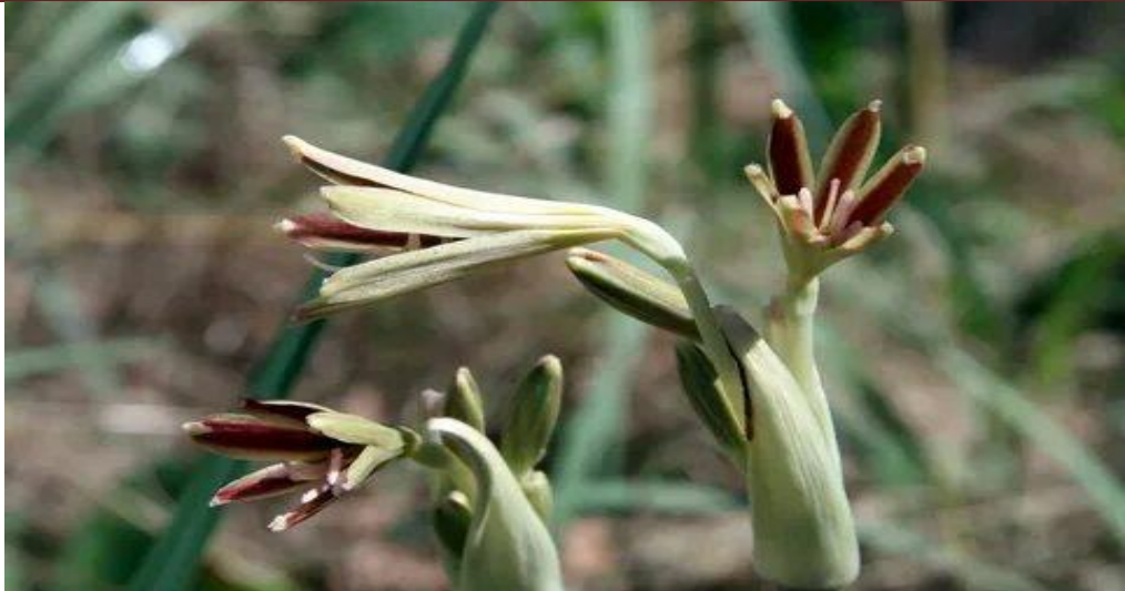
2-rasm. Ungernia victoris- viktor omonqorasi .