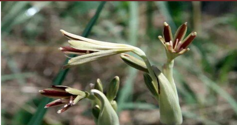
2-rasm. Ungernia victoris - viktor omonqorasi.