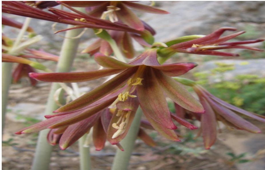
1-rasm. Ungernia sewerzowii- severtsov omonqorasi.

qizil rangli , guli soyabon to`pguliga yig`ilgan. Iyul oyida gullayda , mevasi avgustda pishadi , ko`sak meva. O`simlikning piyozi kuzda , mevasi yerga to`kilgandan keyin kovlab olinadi. Severtsov omonqorasining piyozi tarkibida alkaloidlardan: ungerin, likorin, galaktaminva boshqalar; saponinlar , shilliq moddalar, organik kislotalar , efir moylari kabi birikmalar kiradi. Barglarida 0,45% gacha likorin alkaloidi , 0,05% gacha galaktamin, shuningdek, tasetin, pankratin, narvesin, ungerin, ungminor, unsevin, talanamin, hippeastrin alkaloidlari mavjud.